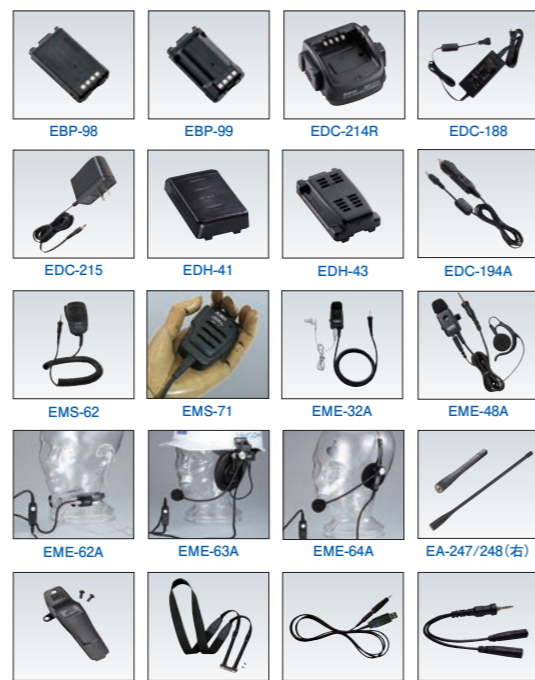
※アクセサリに無線機、ヘルメットなどの小物は付属しません。