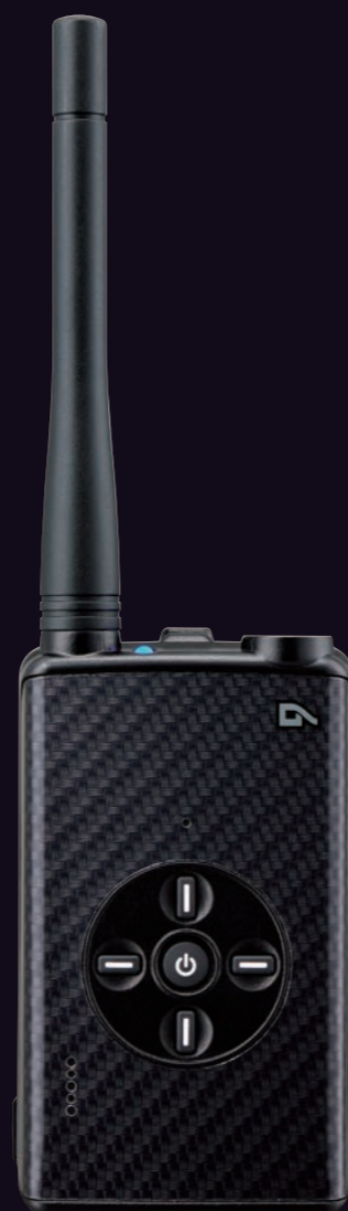
Carbon Black DJ-DPX1KA