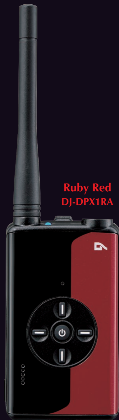
Ruby Red DJ-DPX1RA