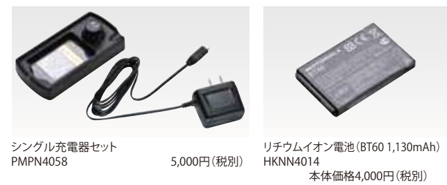
シングル充電器セット PMPN4058 5,000円(税別)