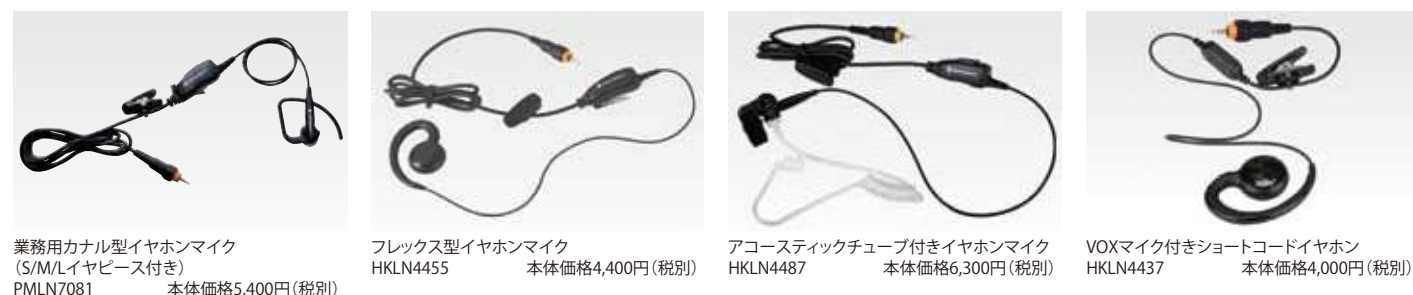
業務用カナル型イヤホンマイク (S/M/Lイヤピース付き) PMLN7081 本体価格5,400円(税別)