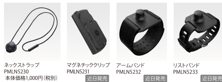
ネックストラップ PMLN5230 本体価格1,000円(税別)